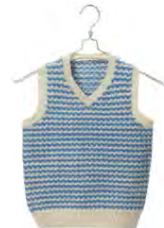
Så här blir mönstret på en slipover.

Mari. Västar och slipover finns också i hennes egen bok.