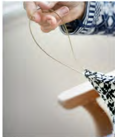
Många av mönstren har vuxit fram efterhand som hon stickat.